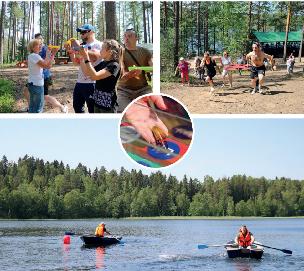
Лидеры спартакиады Горэлектротранса сезона 2022-2023

Самые активные и результативные спортсмены предприятия собрались 17 июня на базе «Фрегат» в Приозерском районе, где прошёл традиционный праздник окончания спартакиады, организуемой ППО ГУП «Горэлектротранс» совместно с администрацией. По легенде, спортсмены попали на остров, где «туземцы» приняли их за «белых богов». Чтобы подтвердить этот статус, спортсменам пришлось выполнить ряд заданий на скорость, ловкость и смекалку. После завершения игровой части состоялось награждение победителей спартакиады сезона 2022-2023.