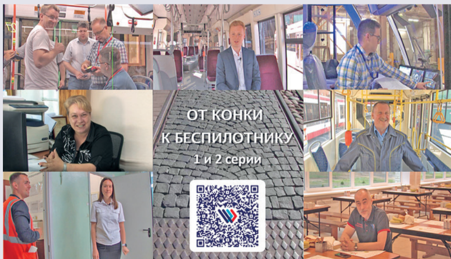
Режиссёр фильма – Татьяна Дьяконова, Телевизионная служба Президентской библиотеки

В кадре: герои фильма Президентской библиотеки «От конки к беспилотнику» о людях Горэлектротранса